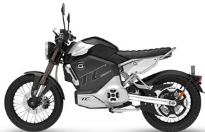
Wersja z felgą szprychową