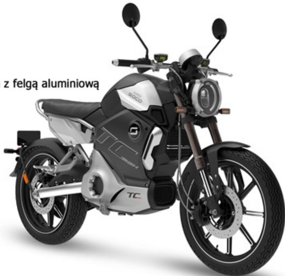
Wersja z felgą aluminiową

4 Certyfikaty Homologacji: EEC, CCIC, CMA, CNA